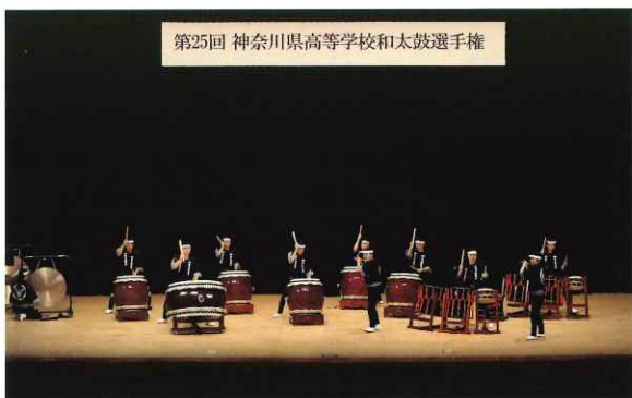
第25回 神奈川県高等学校和太鼓選手権

主な活動は地域での演奏です。また、高文連主催の大会にも出場しています。多くの方に支えられて、創部23年目を迎えることができました。今年度は第49回全国高等学校総合文化祭香川大会に出場し、2位の優秀賞(文化庁長官賞)をいただきました。その結果に伴い、第36回全国高等学校総合文化祭優秀校東京公演にも出場することができました。