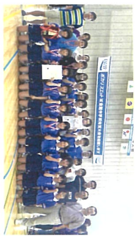
全国中学校卓球大会