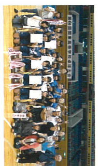
関東高等学校卓球大会