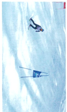
第51回関東高校スキー大会 戸倉スキー場

昨年度は初めてスラローム、ビッグスラロームで関東大会に出場しました。今年の冬もきつと結果を残してくれるはずですが、本校としては小さな活動ですが、力のある生徒が努力していますので、今後とも応援どうぞよろしくお願います!