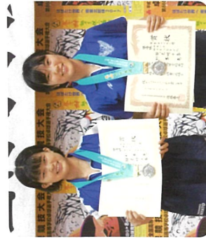
インターハイダブルス準優勝