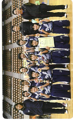
全国中学選抜優勝