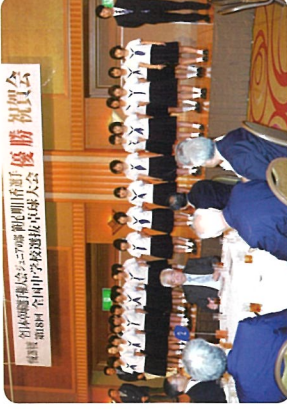
ベイシエラホテルにて祝賀会