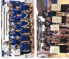
【大会実績】 関東高等学校卓球大会 優勝(団体・シングルス・ダブルス) 全国高等学校総合体育大会 ベスト16(団体) WTTユースコンテナー(国際大会)U-15 準優勝(シングルス) 関東高等学校選抜卓球大会 優勝(団体)

中・高一緒に活動しています。選手一人ひとりが主役であり「部活動による心身の成長」と「日本一」を目標に「全員卓球」の精神で毎日練習に励んでいます。今年度も、新型コロナウイルス感染症対策と練習を両立しつつ、全国大会への連続出場記録を更新しました。4大会(5年)ぶりに関東大会3冠を達成(団体優勝は3大会ぶり)、インターハイでは接戦の末に敗れましたが、団体ベスト16に入ることができました。昨年12月には高3引退後の新チームで臨んだ関東選抜大会にて4年ぶりに優勝し、全国選抜に16大会連続で出場しました。後援会、保護者の皆様をはじめ、支えてくださる多くの方々への感謝と、皆様からの声援を「成長する力」に変えて今後も精進して参ります。今後ともご声援のほどよろしくお願致します。