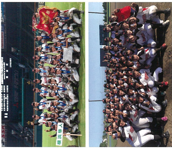
【大会実績】 第26回全国高等学校野球硬式野球選手権大会優勝(8月) 関東女子硬式野球ヴィーナスリーグ 優勝(6月) U16チャレンジャーズナメント 優勝(11月)

皆さんから応援されるチームとなり、東京ドームにたくさんの方々足を運んでもらえるようがんばります。今後も応援よろしくお願いたします。