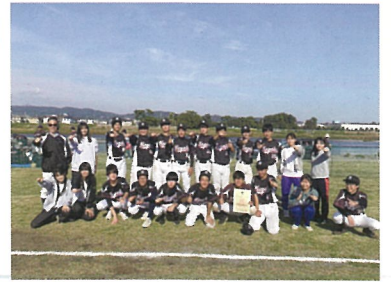
11月 第11回全国私学男子ソフトボール大会関東地区予選会出場 (来年5月の全国私学大会に出場予定)

活動場所・時間が制限されるなか、効率よく練習しています。11月に行われた関東予選で結果を残し、「全国私学ソフトボール大会」への出場を決めました。今後も応援されるチームになるよう練習に励んでいきます。