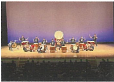
7月 第47回全国高等学校総合文化祭 鹿児島大会 出場 8月 第13回関東地区高等学校和太鼓選手権 金賞・最優秀賞(神奈川県知事賞)

福祉施設での演奏や地域のお祭りなど、年間20回ほどの校外演奏を行っています。今年度は創部以来の念願であった、全国大会(第47回全国高等学校総合文化祭 鹿児島大会)出場を果たすことができました。