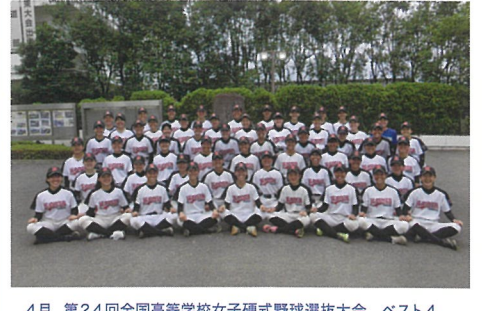
4月 第24回全国高等学校女子硬式野球選抜大会 ベスト4 7月 第27回全国高等学校女子硬式野球選手権大会 ベスト8 10月 第19回全日本女子硬式野球選手権大会 出場

3年13名、2年18名、1年28名、合計59名で活動しています。今年度は春の選抜大会ベスト4、夏の選手権大会ベスト8、そして全日本選手権出場という結果を残すことができました。来年も目指すは「日本一」。