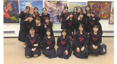
5月 第24回高校生国際美術展 奨励賞1名 佳作1名 第70回神奈川県高等学校美術展 教育長賞1名 高文連会長賞2名 奨励賞3名 8月 第47回全国高等学校総合文化祭 鹿児島大会 出展 (25年連続出展)

中高合わせて50名が在籍しており、展覧会やコンクールに向けて日々作品制作に励んでいます。運動部のインターハイにあたる「全国高等学校総合文化祭(全国大会)」には25年連続で神奈川代表に選ばれています。