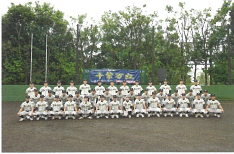
5月 第75回春季関東地区高校野球大会 出場 (令和5年度神奈川県高等学校野球春季県大会 第3位)

今年度は140名の部員が所属しています。今年度の春季大会では県3位となり、関東大会に出場することができました。今年こそは甲子園出場・日本一を達成できるよう精進して参ります。