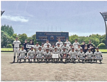
6月 第71回春季関東高等学校軟式野球大会 関東大会 3位

春の県大会は決勝で敗れ、準優勝。神奈川B代表で出場した関東大会(千葉)では準決勝まで進み3位。夏の県大会は決勝戦で敗れ準優勝。今年こそ夏の大会20年ぶりの優勝を目指し、全国大会に出場したいです。