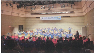
9月 第29回東関東吹奏楽コンクール 銀賞

昨年の東関東大会では、銀賞をいただきました。日々の活動や演奏会について、インスタグラムを見ていただくと嬉しいです。3月26日には県民ホールにて定期演奏会を行います。皆さまのご来場をお待ちしております。