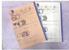
8月 第24回関東地区高校生文芸大会 山梨大会 出場(2年連続出場)

文芸部は小説・詩・短歌・俳句を創作し、部誌を年2・3回発行しています。本年度、関東大会の出場を果たし、また、2023年11月に行われた大会では俳句部門で最優秀賞を受賞し、2024年8月の全国大会出場を決めました。