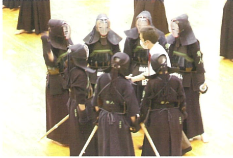
6月 令和5年度 第70回関東高等学校剣道大会 男女アベック団体戦出場 (県大会 男子4位、女子7位)

今年度、関東大会予選で男子4位、女子7位に入賞し、男女アベックでの関東大会出場を果たしました。多くの方から頂いた応援やご支援への感謝の気持ちと、更なる高い目標を持ち、今後も精進してまいります。