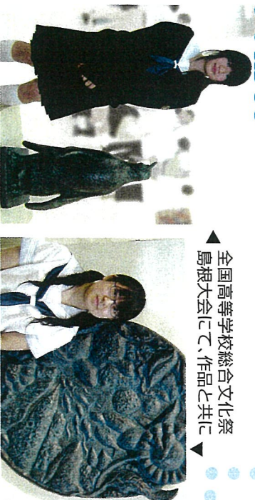
全国高等学校総合文化祭 島根大会にて、作品と共に

私たち美術部は1年を通して、瀬谷区美術展、文化祭、神奈川県高等学校美術展などに向けて絵や彫刻を制作しています。昨年の高校美術展では、高文連会長賞を受賞した本校2名の生徒が全国高等学校総合文化祭島根大会に選ばれ、今年の島根大会に行きました。1年生6名、2年生5名、3年生2名の合計13名と少人数ではありますがありますが、各自一生懸命作品を制作しています。 教販 七海・日吉美南実