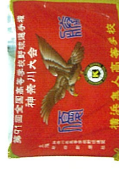
昨年度の県大会優勝旗 しゅぷりか 皆様のご支援ありがとうございました。

日々、文化部や運動部で、心身や技術の向上に一生懸命努力している生徒達を応援しましょう！